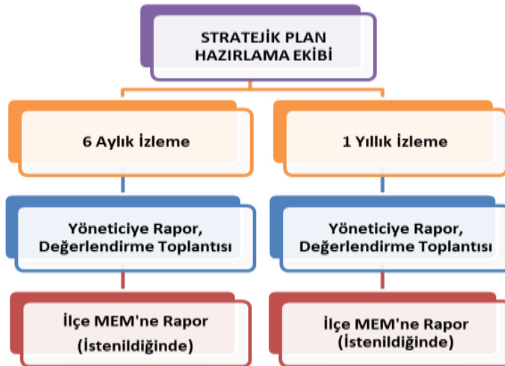
Şekil 3 : İzleme ve Değerlendirme Süreci

Kurumumuzun 2024-2028 Stratejik Planı İzleme ve Değerlendirme sürecini ifade eden İzleme ve Değerlendirme Modeli hazırlanmıştır. Kurumumuzun Stratejik Plan İzleme-Değerlendirme çalışmaları eğitim-öğretim yılı çalışma takvimi de dikkate alınarak 6 aylık ve 1 yıllık sürelerde gerçekleştirilecektir. 6 aylık sürelerde Üst Yöneticiye rapor hazırlanacak ve değerlendirme toplantısı düzenlenecektir. İzleme-değerlendirme raporu, istenildiğinde Stratejik Geliştirme Başkanlığına gönderilecektir. Ayrıca ilçemizin Mülki İdari Amirine sunulacaktır. 1 yıllık izleme-değerlendirme çalışmaları, Stratejik Planımızda yer alan hedeflerin yıllık düzeyde ifade edildiği Performans Programı ve yılsonunda gerçekleşme düzeylerinin belirlendiği Faaliyet Raporu hazırlanarak yapılacaktır. Performans Programı ve Faaliyet Raporu Üst Yöneticinin değerlendirmesinin akabinde Strateji Geliştirme Başkanlığına ve Mülki İdari Amire sunulacaktır. Yıllık izlemelerle ilgili değerlendirme toplantıları düzenlenecektir.